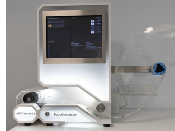
Inspektionsgerät (Pouch Inspector)

Durch die Zeitersparnis für das Pflegepersonal bleibt mehr Zeit für Ihre Versorgung. Mit Hilfe der elektronischen Patientenakte und des Unit-Dose-Systems entsteht ein geschlossener Medikationskreis, welcher den Vorteil bietet, dass das gesamte Personal die identischen und aktuellsten Informationen hat.