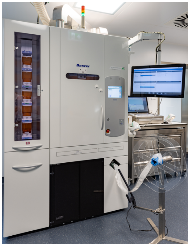
Unit-Dose-Automat der Firma Baxter

Ihre Medikamente werden weiterhin nach ärztlicher Anordnung für Sie bereitgestellt. Allerdings werden Ihre Medikamente nicht mehr ausschließlich von Pflegefachkräften auf der Station gerichtet, sondern in der Apotheke individuell und mit modernster Technik für Sie bereitgestellt.